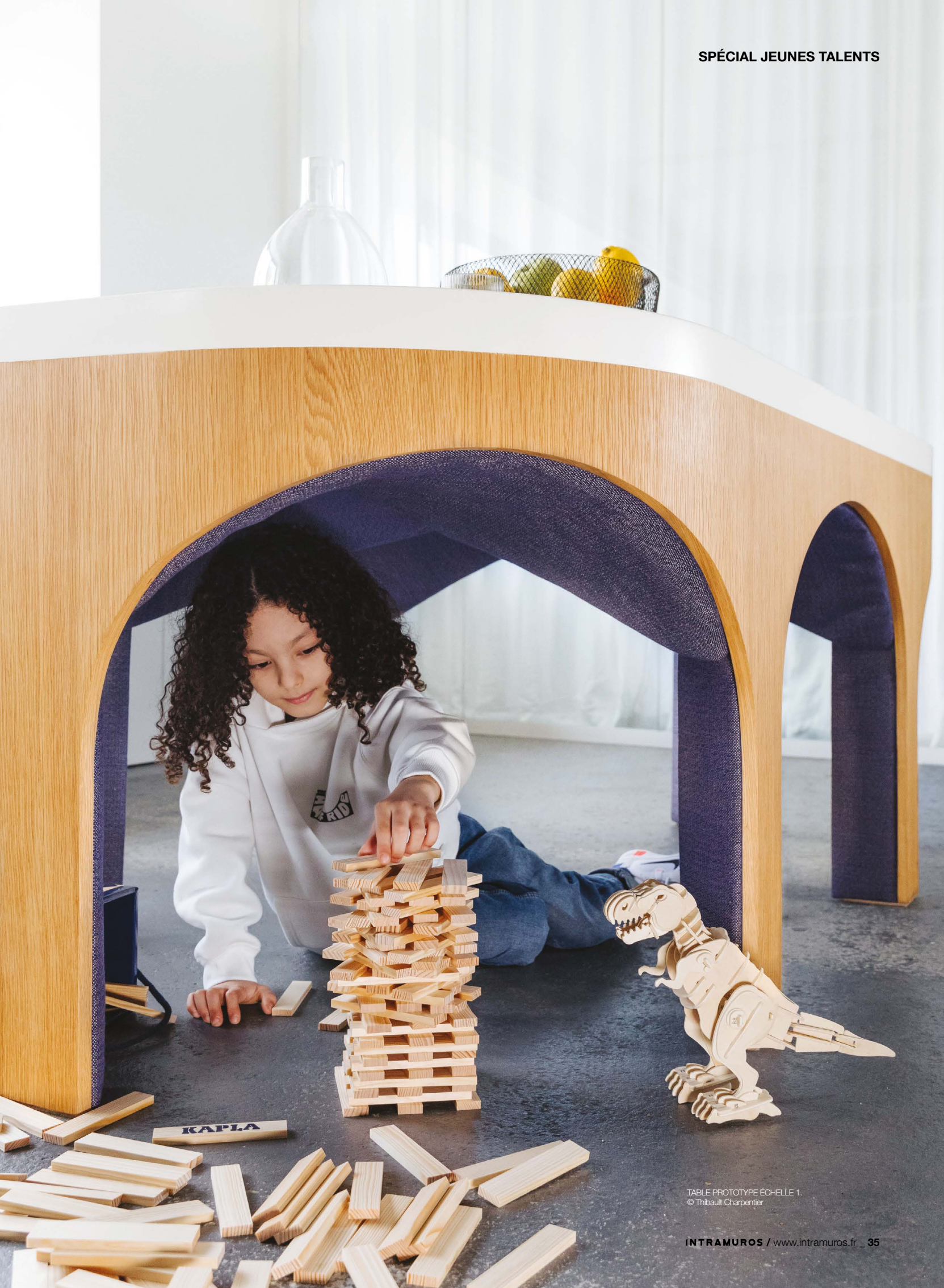
TABLE PROTOTYPE ÉCHELLE 1.