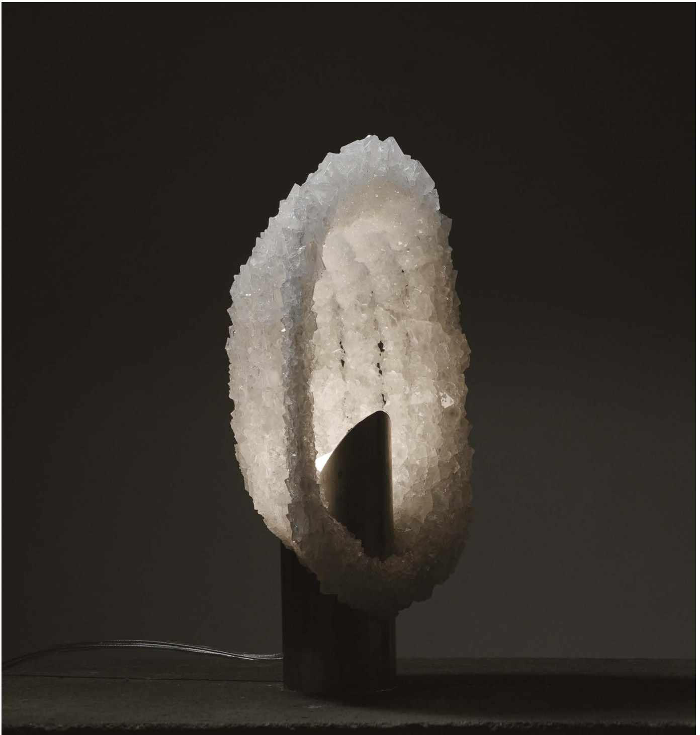
LAMPE ALUMINE © Richard Ducros