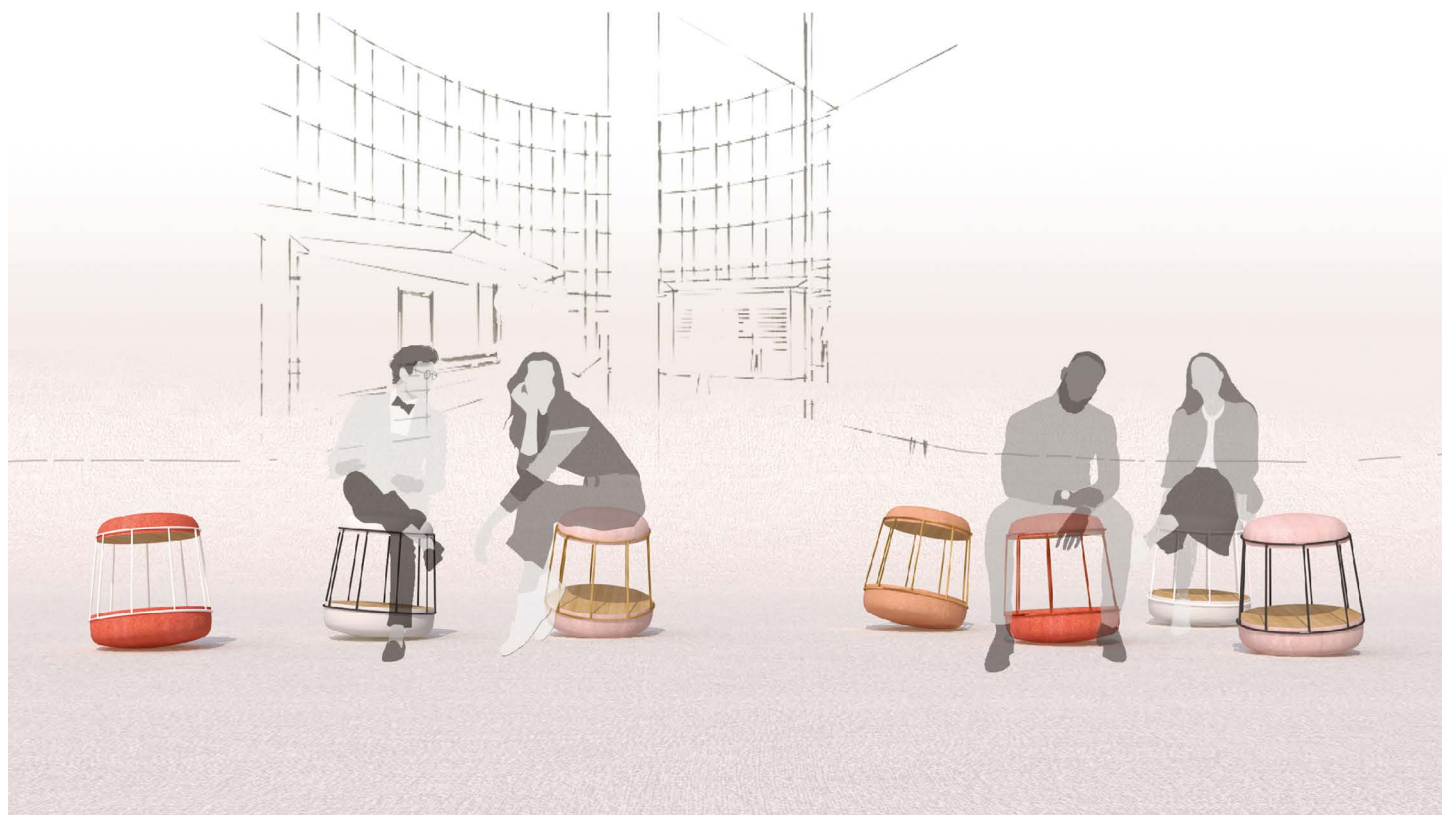
ASSISE CULBUTO © Moore Design/Juliette Droulez