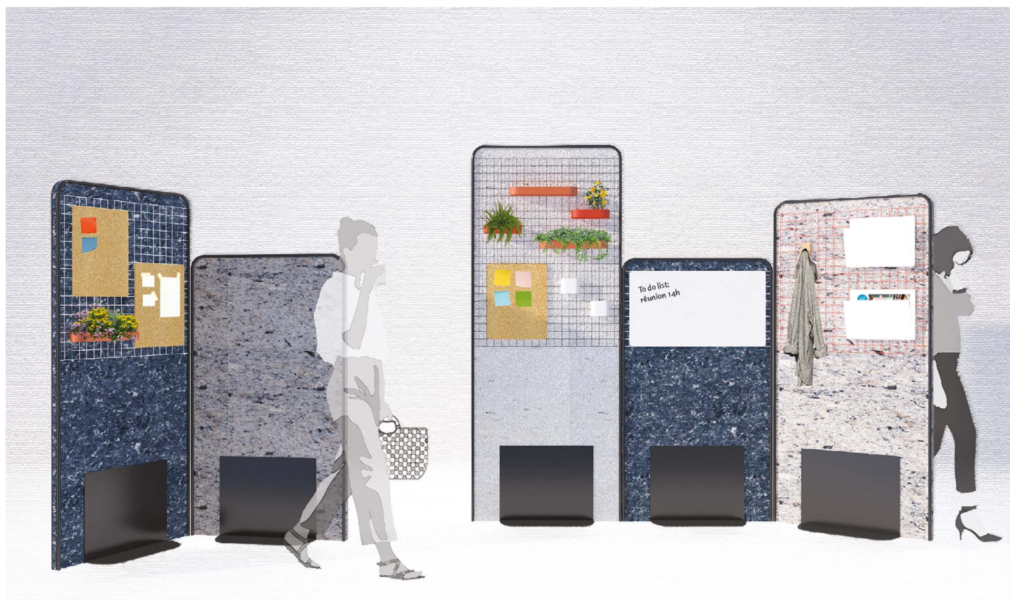
PROJET DE CLOISON ACOUSTIQUE © Moore Design/Juliette Droulez