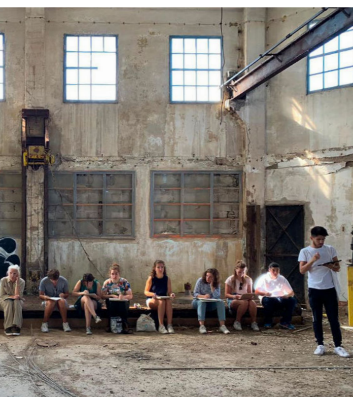
3 Santa Caterina Art center, site à destin réversible école Camondo