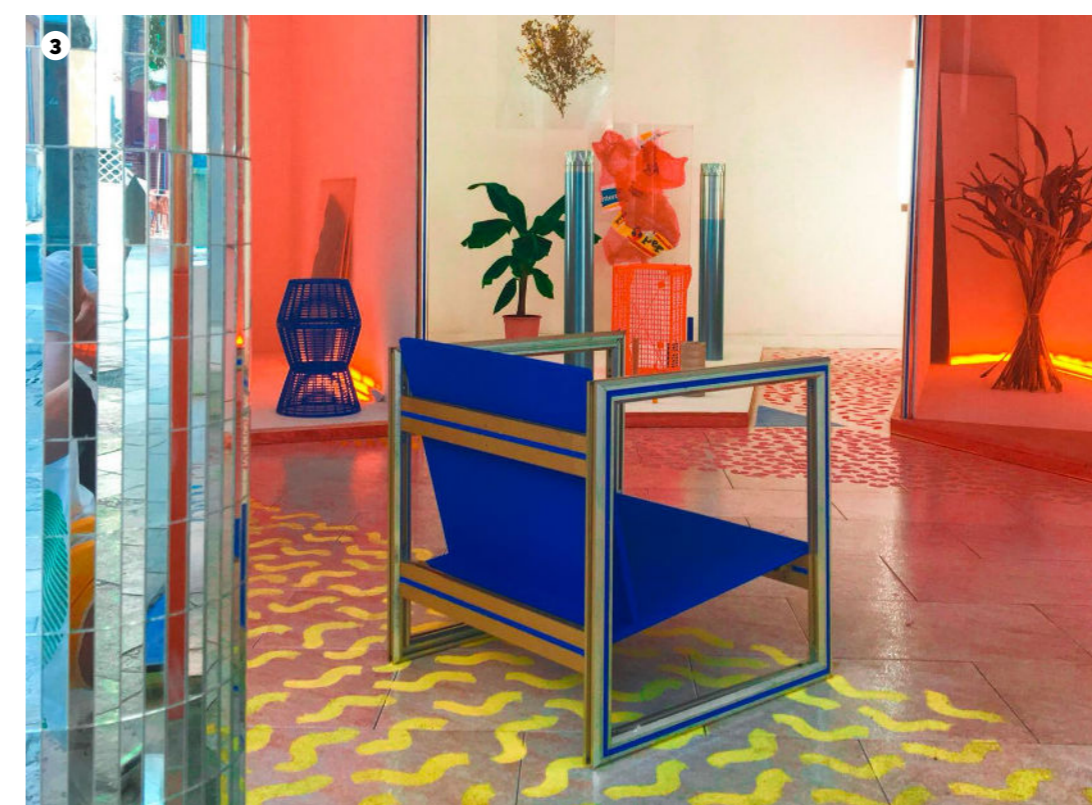
4 Monique boutique habille chic à prix modique Workshop trans-année, exposition pendant le Festival Design Parade Architecture intérieure de Toulon, 2019