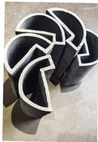
Aguttes ; Centre Pompidou, MNAM-CCI, akg-images ; Maruani Mercier