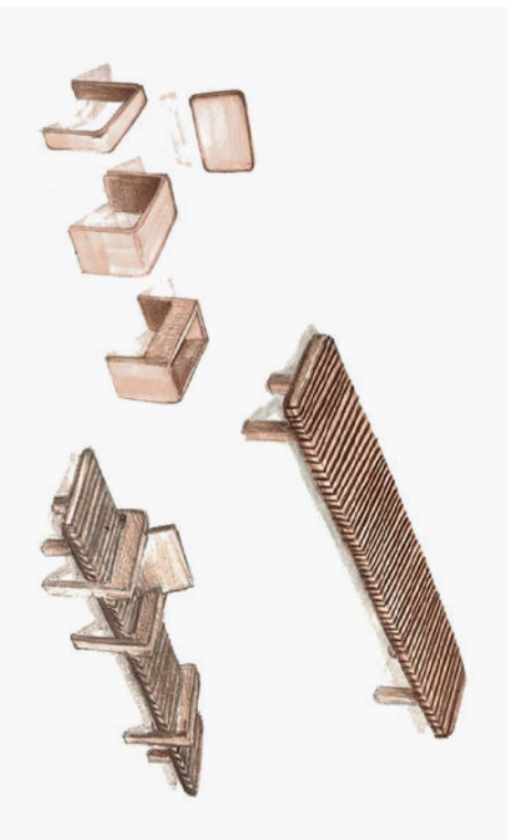
← Luna Laffanour et Lorraine Touzery